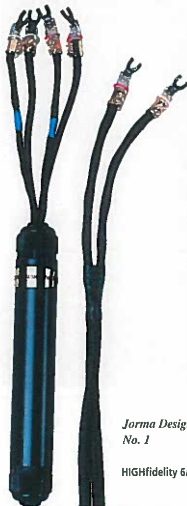
Jorma Design No. 1

I højttalerenden befinder sig store klodser, der hver indeholder 4 stk. Bybee Quantum Purifiers. Der er tale om en keramisk leder, som angiveligt skal have en positiv indflydelse på lyden. På Bybee's egen hjemmeside ( www.bybee.com ), kan man læse en masse (noget pseudovidenskabeligt må vi nok sige, red.) udenomssnak om hvordan og hvorfor de virker. Angiveligt skulle det dreje sig om militære hemmeligheder, hvorfor der ikke kan afsløres særligt meget (... red.). Der er til stadighed store diskussioner om hvorvidt Bybee er rent