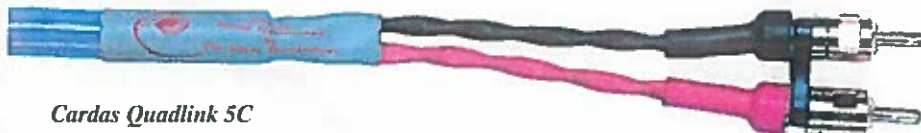
Cardas Quadlink 5C