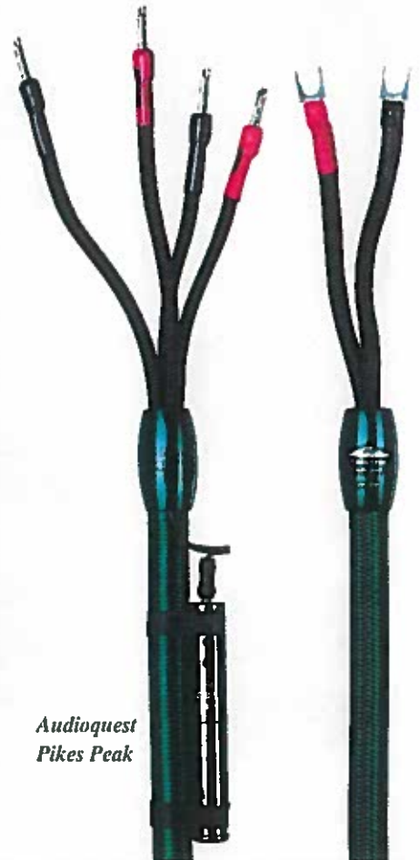
Audioquest Pikes Peak

Det første indtryk er "detaljer". Dette understreges af et let hæb i de øvre frekvenser, som kan forekomme lidt for meget i uheldige tilfælde. Det dybe bas område er let dæmpet, eller måske lyder det bare sådan, fordi der fokuseres på den øvre bas som gengives med magt og robusthed. Specielt bemærkede vi de på SACD pladen med Romeo og Julie. Her var der en ekspansionssevne og tyngde i det egentlige basområde, som fik de mindre højttalere til at lyde lidt større.